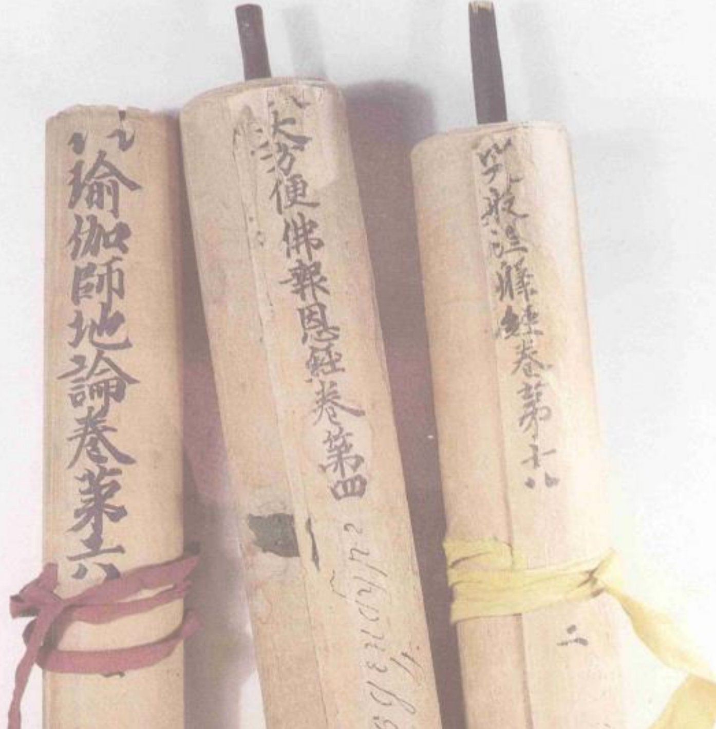
Buddhist scrolls from Dunhuang F.072, F.077 and F.094 Institute of Oriental Manuscripts, St. Petersburg