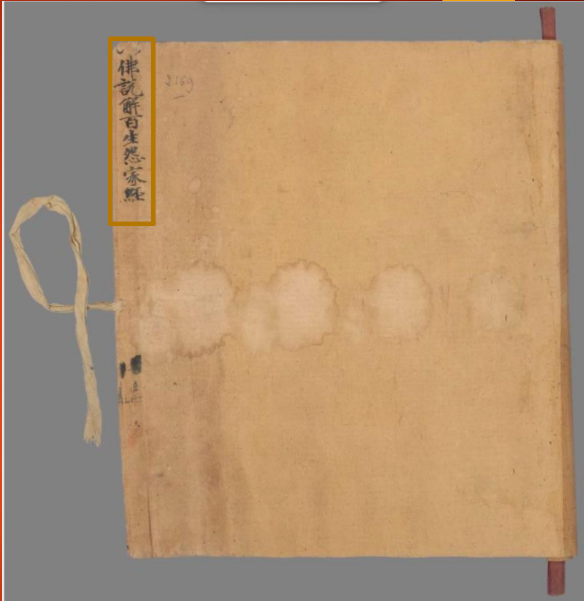
Pelliot chinois 2169, verso