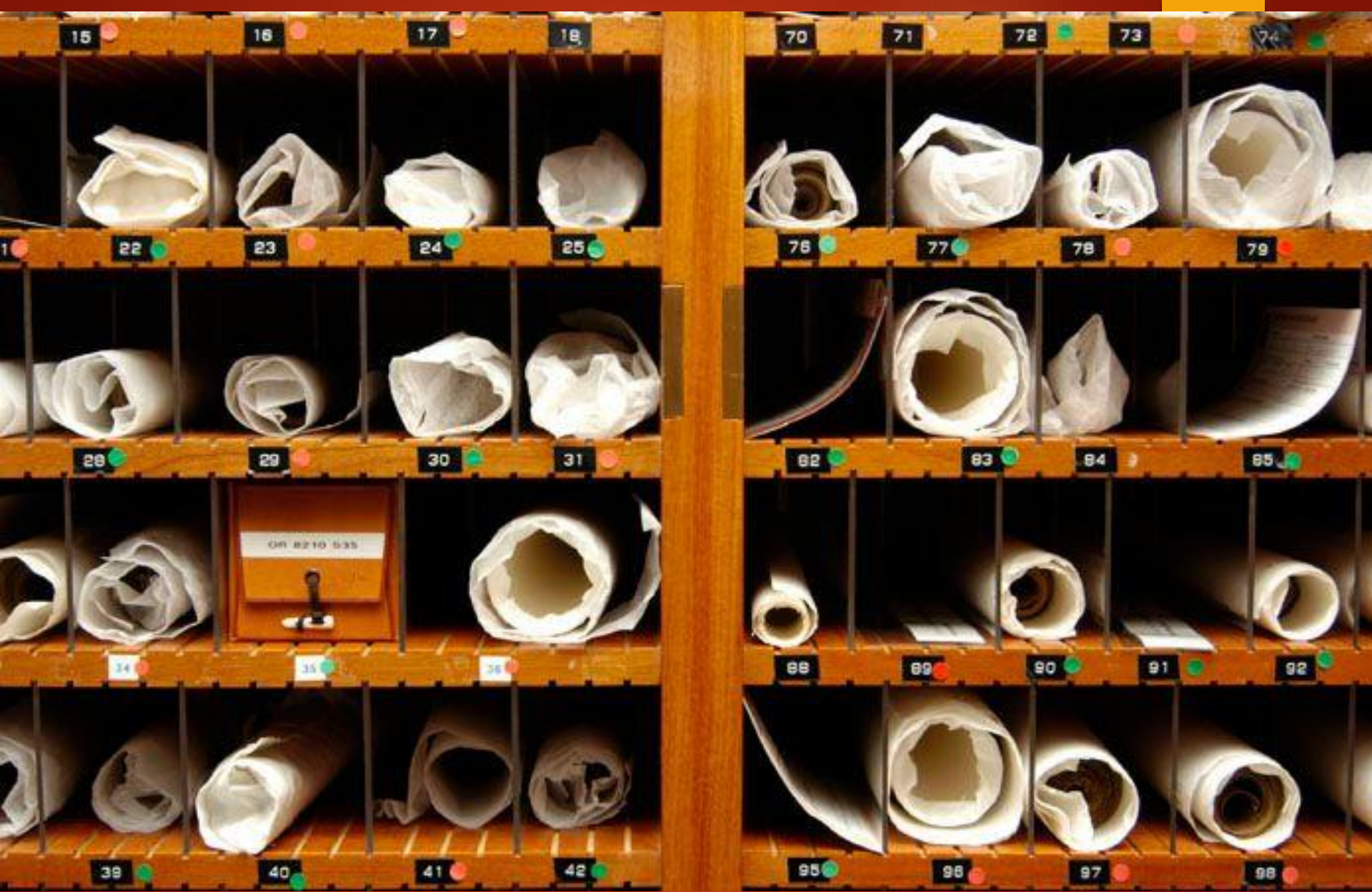
Dunhuang manuscripts at the British Library