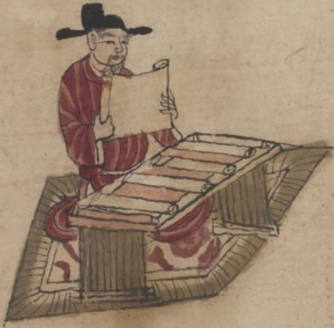
Underworld official reading a scroll Pelliot chinois 4523, Bibliothèque nationale de France 10th century