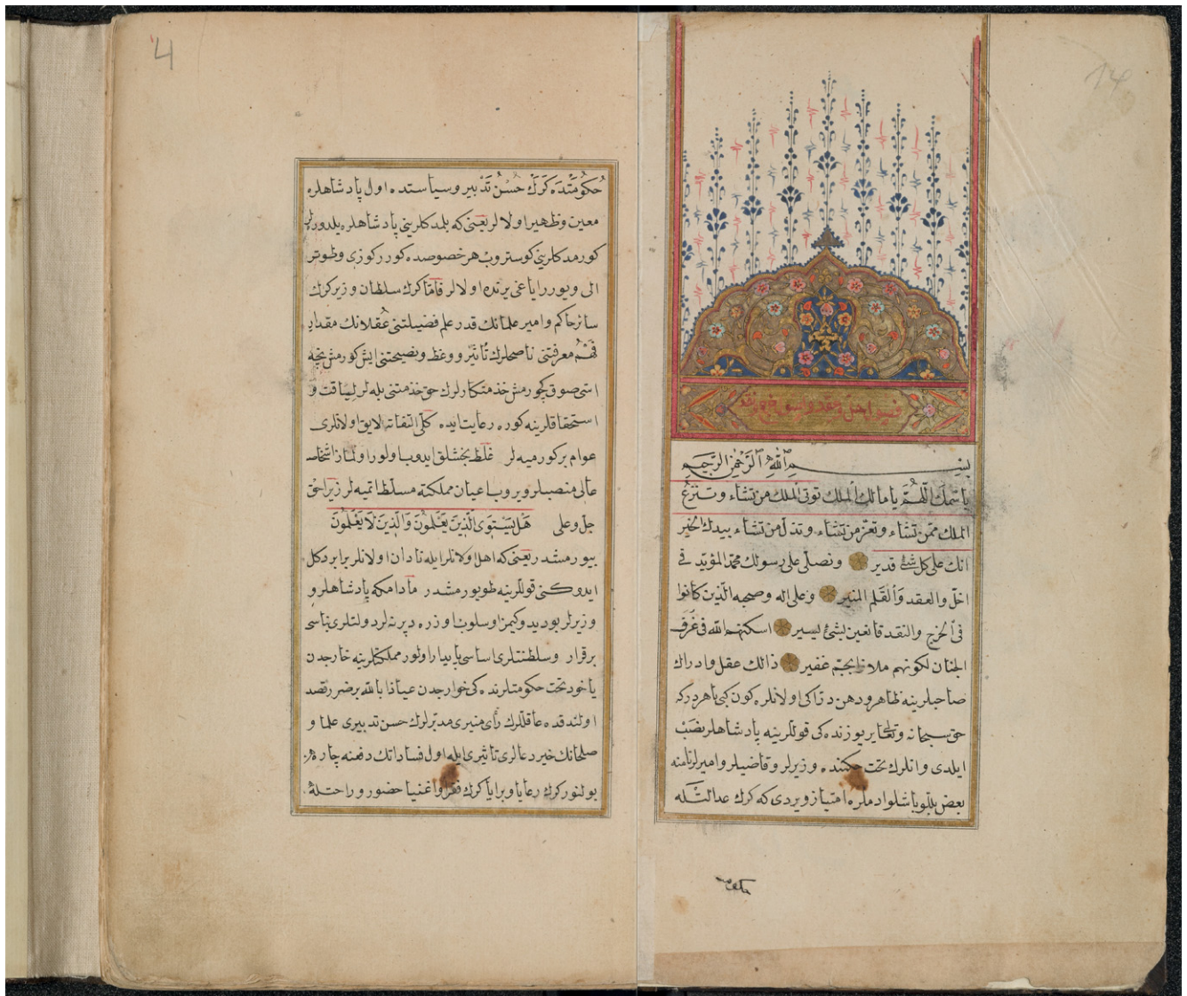
Fig. 1: SUB HH, Cod. orient. 315, fols. 3 v /4 r .