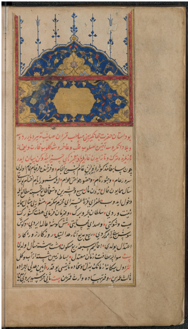
Fig. 2: SUB HH, Cod. orient. 268c, fol. 1 r .

Two further Hamburg manuscripts, Cod. orient. 315 (figs. 1 and 3) and Cod. orient. 332 (fig. 4), contain texts from the same body of early Ottoman chronicles, all of them having a rather complicated background in terms of textual tradition. Cod. orient. 332, also acquired by Andreas David Mordtmann senior, was copied by a relatively high-ranking Ottoman official in the mid-nineteenth century in riķ‘a , the written style used in official documents. Containing a fabled history of Istanbul along with an early Ottoman chronicle, this manuscript has barely been examined by scholars. The same applies to the beautiful Cod. orient. 315, which was produced earlier and the second part of which concurs with the section covering the founding of Istanbul. Not even Stéphane Yerasimos was aware of them (Yerasimos 1990).