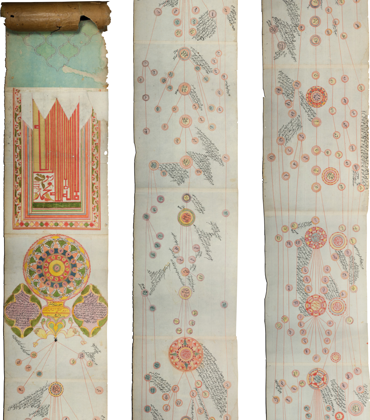
Privatbesitz Nr. 2. Detail. 1824, Osm. Reich. Genealogische Rolle ( silsilenâme ) mit den Herrschern und Propheten von Adam bis Sultan Mahmüd II. (reg. 1808–1839). Die ersten dreieinhalb Meter der 14,80 m langen Rolle (vgl. Kap. 9.3.2). | Private ownership no. 2. 1824, Ottoman Empire. Genealogical scroll ( silsilenâme ), depicting the rulers and prophets from Adam to Sultan Mahmüd II (r. 1808–1839). The first 3.5 m of the scroll (14.8 m total length) (cf. section 9.3.2).