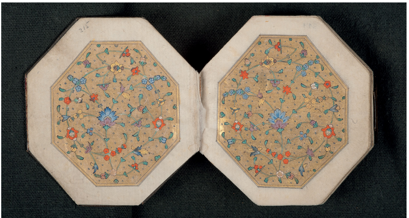
Fig. 4: SUB HH, Cod. in scriin. 199, fols. 314ʳ/315ʳ.

There is no standard shape or size for sanjak Qurans. They were often produced in an octagonal format, however, such as that exhibited by Cod. in scriin. 199 from the Hamburg