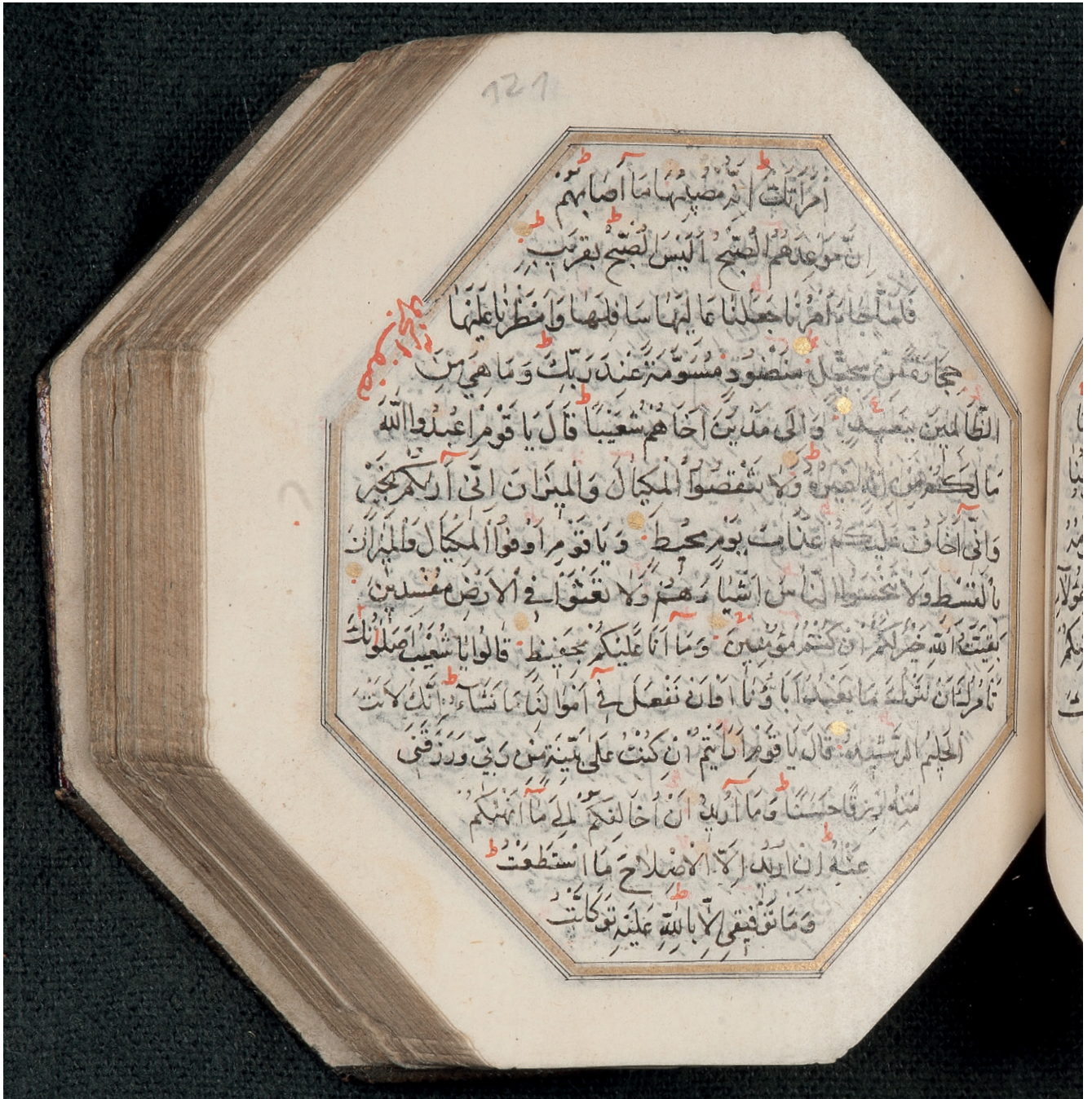
Fig. 1: SUB HH, Cod. in scriin. 199, fol. 121'.