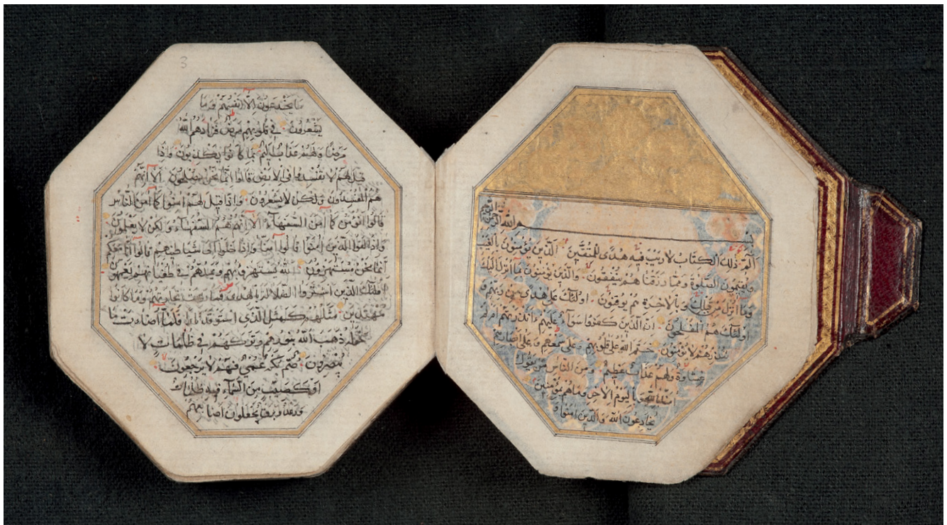
Fig. 2: SUB HH, Cod. in scrin. 199, fols. 2 v /3 r .

Various suras and verses in the Quran, including ‘The Opening’ ( al-Fātiḥa ) and the ‘Throne Verse’ ( Āyat al-Kursī , 2:255), are ascribed the power to bring good fortune and protection. They are found as inscriptions on the walls of buildings or written on objects which are carried in a pouch or attached to a necklace in order to protect their owner. The most powerful amulet is considered to be the Quran in its entirety, however. Numerous Quran manuscripts that have