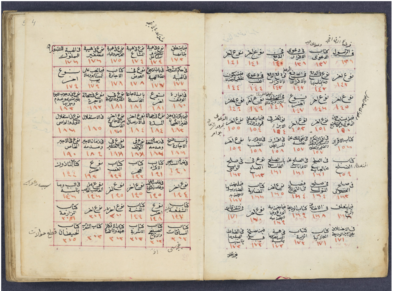
SUB HH, Cod. orient. 320, fols. 3 7 / 4 . Tabellarisches Inhaltsverzeichnis einer Handschrift mit verschiedenen fetvā -Sammlungen. Vermutl. 18. Jh., Osm. Reich (vgl. Kap. 3.6.2 und 9.2.2). | Table of contents of a manuscript with various fetvā collections, presented in tabular form. Presumably from the 18th century, Ottoman Empire (cf. section 3.6.2 and 9.2.2).