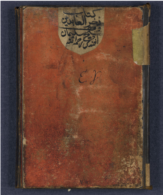
Fig. 2: SUB HH, Cod. orient. 78. Einband vorne. | Front cover.

ge im Mondjahr. Die Abschrift wurde im Jahre 1066 n. H. (1655) abgeschlossen und mag wohl von Şeyh Süleymân beim Kopisten, einem Aḥmed bin Bekir, in Auftrag gegeben worden sein. Süleymân kannte sicher Ḥiṣālî Ḥüseyin bin Aḥmed aus Buda, den Kopisten seiner türkischen Sammlung von Sprüchen der vier ersten Kalifen (Fig. 3), auch wenn die im Jahre 1028 n. H. (1619) abgeschriebene Handschrift am Anfang unvollständig ist – konnte Şeyh Süleymân dies nicht mehr ergänzen lassen?