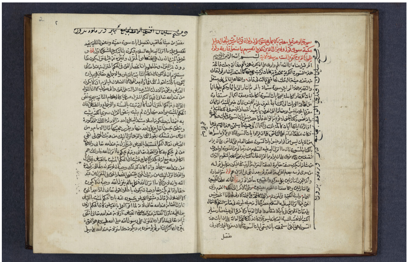
Fig. 1: SUB HH, Cod. orient. 63, fols. 1v/2r.

Cod. orient. 78 contains an Arabic text on the special religious significance of certain months and days in the lunar