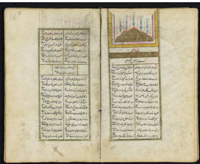
Fig. 3: SUB HH, Cod. orient. 323, fols. 35 r /36 r .