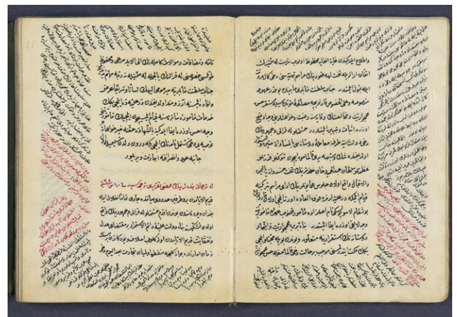
Fig. 2: SUB HH, Cod. orient. 311, fols. 64 r /65 r .

In more elaborate manuscripts, rhyming texts were written in two to eight columns with one hemistich in each column; the last two hemistichs of a poem were often indented and positioned one below the other. The text fields set inside borders (cedvel, see below) were then framed (fig. 3).