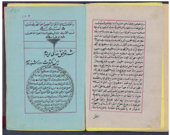
Fig. 6: SUB HH, Cod. orient. 326, fols. 186 r /187 v .