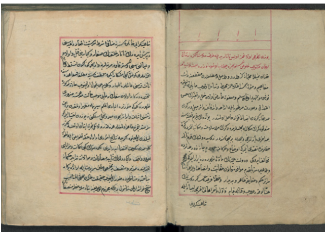
Fig. 1: SUB HH, Cod. orient. 311, fols. 1 r /2 r .

In aufwendigen Handschriften wurden gerimte Texte in zwei (bis acht) Spalten geschrieben, pro Spalte stand je ein Halbvers, die beiden letzten Halbverse eines Gedichts wurden oft eingerückt untereinander platziert. Danach wurden die Textfelder von Randleisten (cedvel, s. u.) gerahmt (Fig. 3).