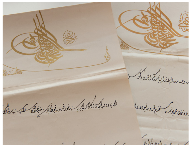
Fig. 3: Internationales Maritimes Museum Hamburg (IMMH), Inv.-Nr. IMMh/K-41j/NL Busse.

A veşiķa or belge was an official document issued by the sultan’s chancellery and vizierate, provincial courts and the şeyhülislām . It was decorated increasingly lavishly and folded several times. Apart from being a letter, it could also be a sultan’s decree ( ferman ) or certificate of ownership or appointment ( berāt ) (fig. 3) (cf. sections 7.1 and 7.2).