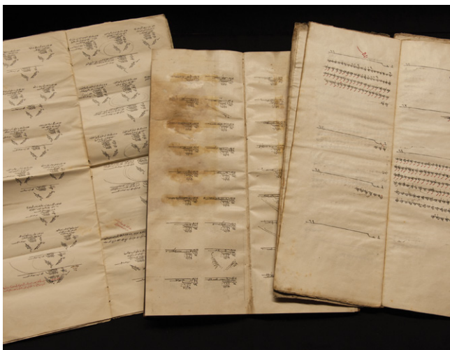
Fig. 2: SUB HH, Cod. orient. 346.1, Cod. orient. 17a, Cod. orient. 17.1 (von links nach rechts). | (from left to right).

Die oft gefalteten und zunehmend üppig ausgestalteten Urkunden wurden von Kanzleien des Sultans und der Wesirate, der Provinzhöfe sowie des şeyhülislām ausgestellt. Hierunter Sultanserlasse (Fermane) und Besitztums- und Ernennungs-urkunden ( berāt ) sowie Briefe (Fig. 3). (Vgl. Kap. 7.1 und 7.2).