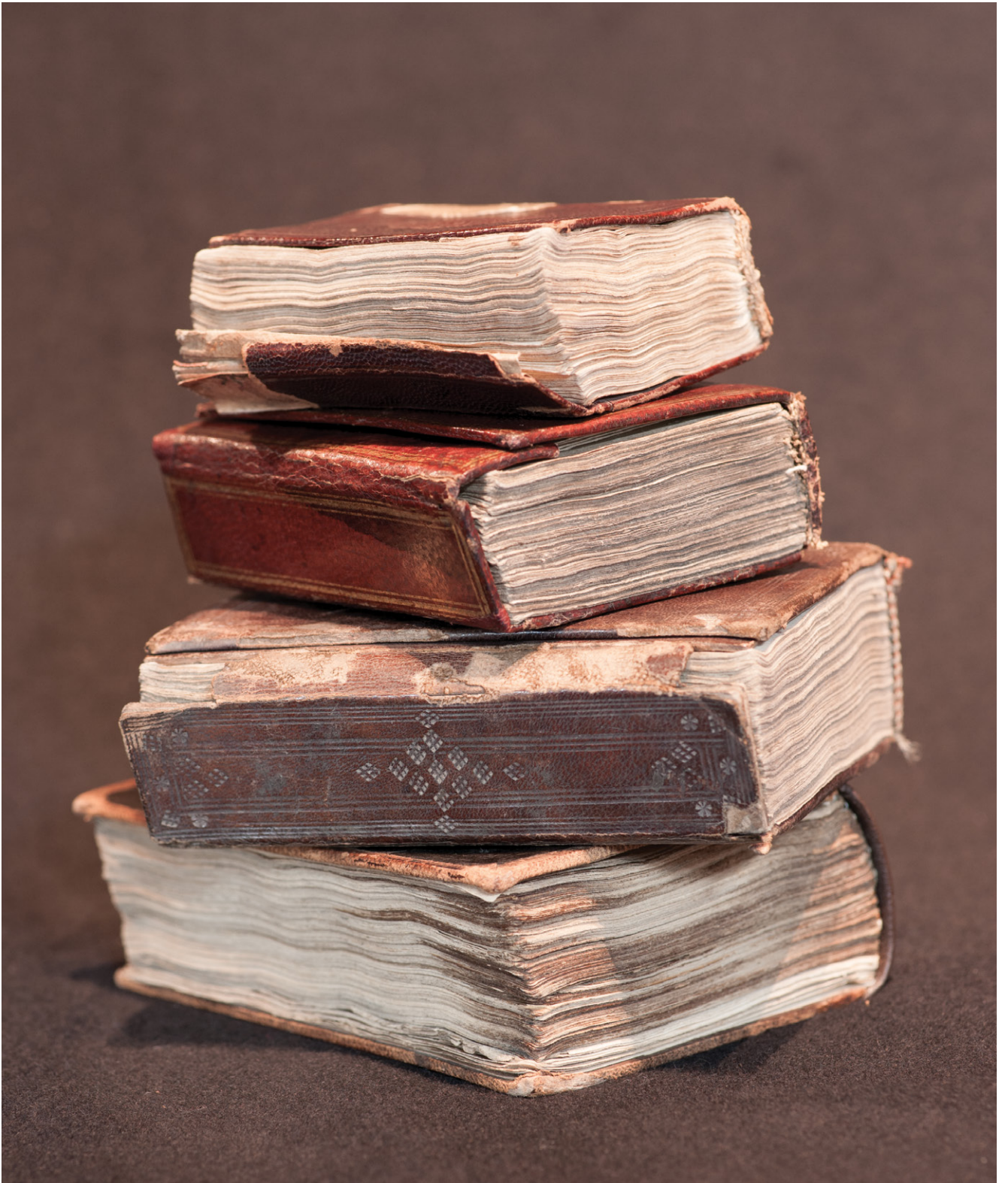
Fig. 1: SUB HH, Cod. orient. 5, Cod. orient. 4, Cod. orient. 93a, Cod. orient. 135 (von unten nach oben). | (from bottom to top).