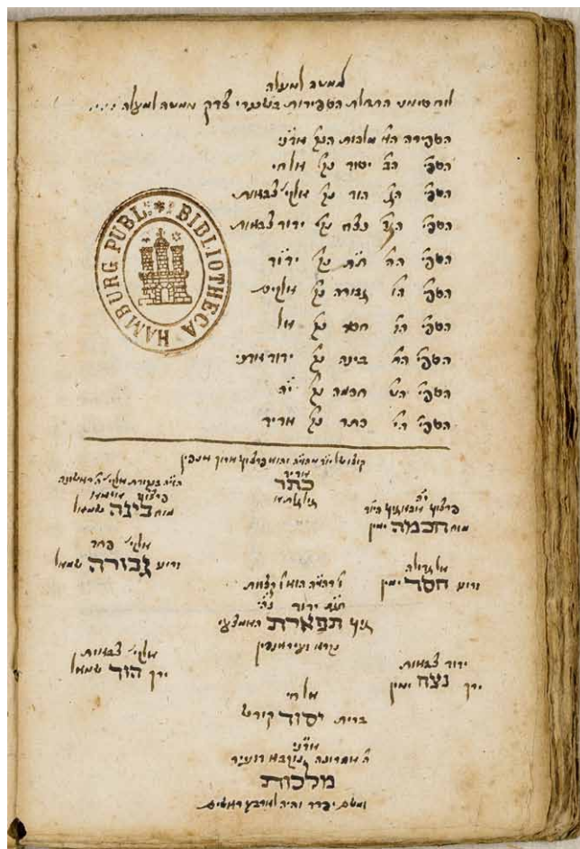
Fig. 3: Cod. hebr. 176, fol. 62 v : 10 sefirot.