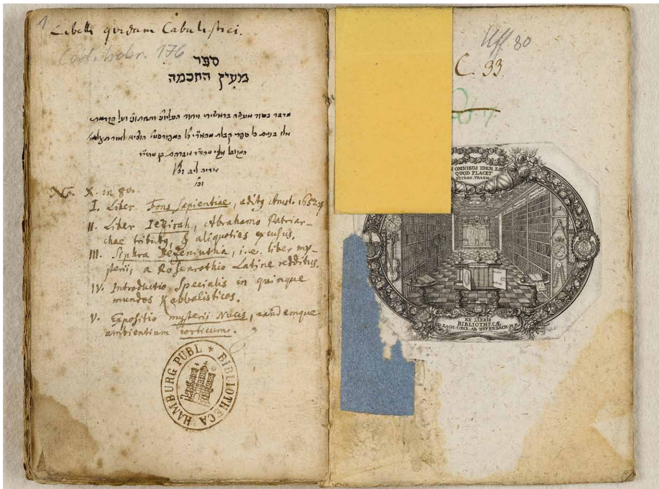
Fig. 1: Cod. hebr. 176, fol. 1 r : Exlibris von Zacharias Conrad von Uffenbach, Titelblatt. | Exlibris of Zacharias Conrad von Uffenbach, title page.

Abraham ben Arye Loeb, Sefer Ma'ayan ha-Hokhma (Book of the Source of Wisdom); Sefer Yesira (Book of Creation); Sifra di-Šni'uta (Book of Discreetness); Pseudo-Abraham ben David, Commentary on Sefer Yesira ; Josef Gikatilla, Sha'are Šedeq (Gates of Righteousness).